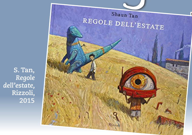
S. Tan, Regole dell'estate, Rizzoli, 2015